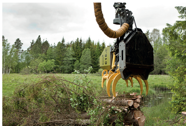
Défrichage efficace combiné à la possibilité de trier des matériaux utiles comme la biomasse.