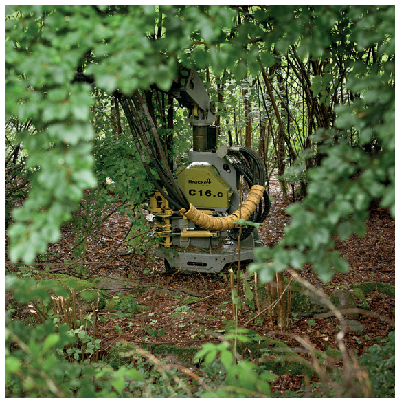
Bracke C16.c, tête d'empilage à accumulation destinée à la bioénergie et à l'entretien forestier.