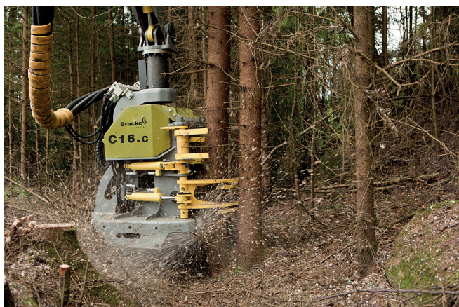
Système de coupe breveté unique avec capacité d'empilage supérieure.