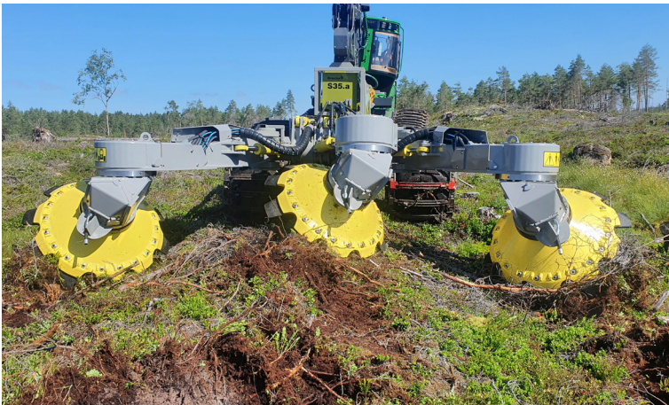
Bracke S35.a voidaan asentaa yksi-, kaksi- tai kolmirivisiin maanmuokauslaitteisiin.