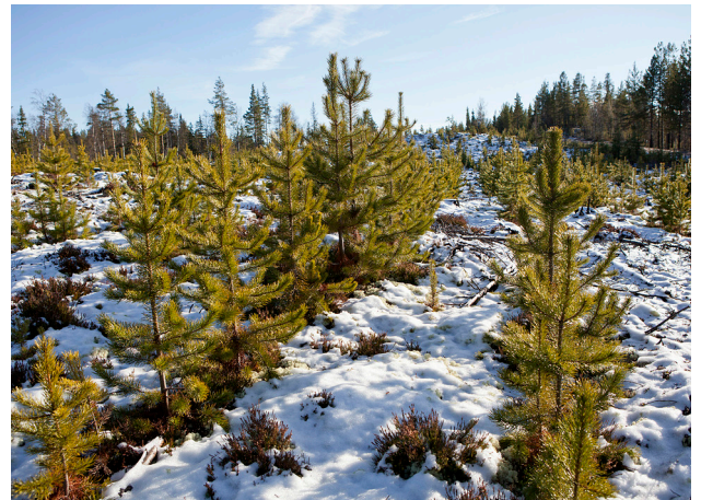
Erittäin hyvä tuotanto S35.a:lla suoritettun maanmuokkauksen ja kylvön jälkeen.